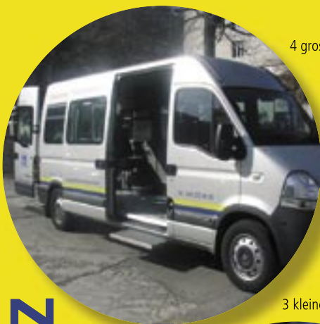
4 grosse Busse (1-5 Rollstühle)