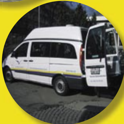
3 kleine Busse (1-3 Rollstühle)