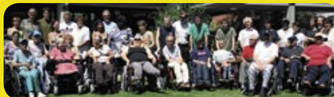
Verein Behinderten-Reisen Zürich

Telefon 044 272 40 30 Telefax 044 272 49 10 Mail: email@vbrz.ch PC Konto 80-765-1