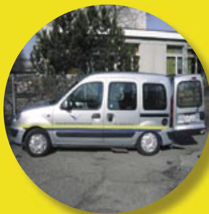
3 Kombis (1 Rollstuhl)